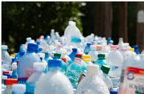
Fot. 1. Generujemy zdecydowanie za dużo plastikowych odpadów Photo. 1. Plastic wastes were produced in the strongly too much amount

Składowanie odpadów PET jest poważnym problemem ekologicznym z uwagi na niską biodegradowalność tego materiału w środowisku. Każdego roku do mórz i oceanów trafiają miliony ton plastikowych śmieci. Większe i mniejsze (tzw. mikroplastik) jego cząsteczki stanowią ogromne zagrożenie dla morskich ekosystemów.