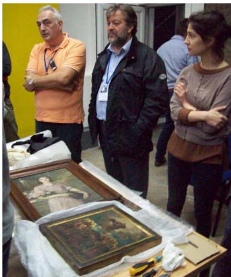
Fot. 4. Przygotowanie obiektów historycznych do badań radiograficznych. W środku Stefano Ridolfi, światowej sławy ekspert w zakresie identyfikacji i konserwacji dzieł sztuki, ekspert Międzynarodowej Agencji Energii Atomowej [2]

cia w naddunajskiej miejscowości Vinča, 16 km na wschód od Belgradu dokonał w 1908 r. serbski archeolog Miloje Vasić. Jest to unikatowy rejon badawczy, przypominający nieco Pompeje zniszczone w czasach cesarstwa rzymskiego przez erupcję wulkanu Wezuwiusz. Popiół wulkaniczny utrwalił budowle, przedmioty oraz niektóre ciała ludzi i zwierząt, co umożliwiło obejrzenie wyglądu starożytnego rzymskiego miasta średniej wielkości i jego mieszkańców.