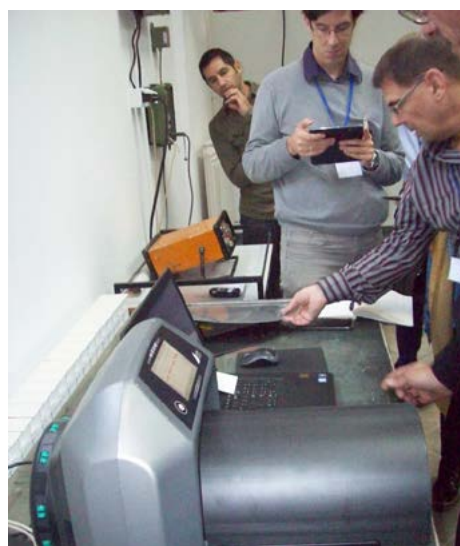
Fot. 3. Skaner do odczytu i rejestracji obrazów

ści promieniowania otrzymanego podczas ekspozycji. Światło jest następnie wykrywane przez bardzo czułe urządzenie analogowe znane, jako fotopowielacz (PMT) i przekształcane na sygnał cyfrowy za pomocą przetwornika analogowo-cyfrowego (ADC). Wygenerowany cyfrowy obraz rentgenowski można następnie wyświetlić na monitorze komputera i analizować. Zasadniczo technologię CR można uznać za cyfrowy zamiennik konwencjonalnej folii rentgenowskiej. Płytki obrazowe są używane z tymi samymi metodami i technikami kontroli radiograficznej, co filmy, a także są dostępne w różnych klasach systemów, (jakość obrazu), które mają różne wymagane czasy ekspozycji. Jednak w technologii CR nie tylko rodzaj płytki obrazowej wpływa, na jakość obrazu, ale również ustawienia sposobu skanowania.