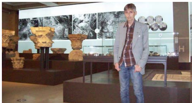
Fot. 4. Fragment ekspozycji w Muzeum Narodowe w Belgradzie

W przypadku Vinči naddunajskie osiedla były, co jakiś czas narażone na powódzie, które nanosiły warstwy gliny i piasku. W ten sposób zachowało się wiele przedmiotów z okresu obejmującego ponad 7 000 lat. Archeolodzy warstwa po warstwie wydobywali z osadowej glinianej skały artefakty z różnych epok historycznych. Znaleźiska z miejsca wykopalisk są przechowywane w Muzeum Narodowym w Belgradzie i w Kolekcji Archeologicznej Wydziału Filozofii w Belgradzie.