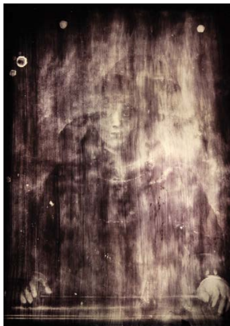
Fot. 1. Radiogram obrazu „Dama w ramie obrazu” Photo. 1. Radiogram of the painting „Lady in the picture frame”

znajdujący się pod obecnym malowidłem. Jest to ślad niedokończonego portretu: widoczny jest kształt głowy, krzyży i ramion.