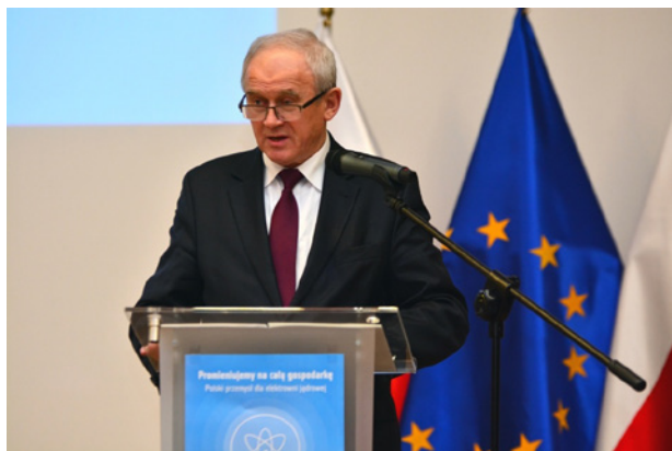
Fot. 2. Przemawia minister energii Krzysztof Tchórzewski Phot. 2. Minister of Energy Krzysztof Tchórzewski addresses the audience

Licznie zebranych gości: członków rządu, parlamentarzystów, ambasadorów, dostawców urządzeń i usług dla branży jądrowej, specjalistów z sektora energetyki, pracowników instytutów atomistyki i przedstawicieli mediów powitał minister energii Krzysztof Tchórzewski. W swoim wystąpieniu minister powiedział m.in., że energetyka jądrowa jest mało awaryjna i zapewnia ciągłość dostaw. Musimy jednak znaleźć odpowiedni model finansowania dla projektu budowy elektrowni jądrowej – podkreślił minister energii Krzysztof Tchórzewski.