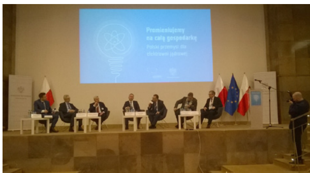
Fot. 1. Uczestnicy jednego z paneli

Konferencja była intensywnie promowana i wywołała duże zainteresowanie. Wobec różnych informacji dochodzących z Ministerstwa Energii i Ministerstwa Rozwoju dotyczących Programu Polskiej Energetyki Jądrowej (PPEJ) spodziewano się, że podczas konferencji przedstawiciele wymienionych ministerstw przełożą opinii publicznej jednoznaczne stanowisko polskiego rządu na temat realizacji PPEJ.