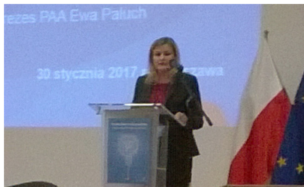
Fot. 4. Wiceprezes Państwowej Agencji Atomistyki Ewa Paluch

W dyskusji, podobnie jak po pierwszym panelu, zwracano uwagę na konieczność pomocy rządu dla firm przemysłowych, potrzebę „spolonizowania projektu”, posiadanie odpowiednio wykształconych kadr.